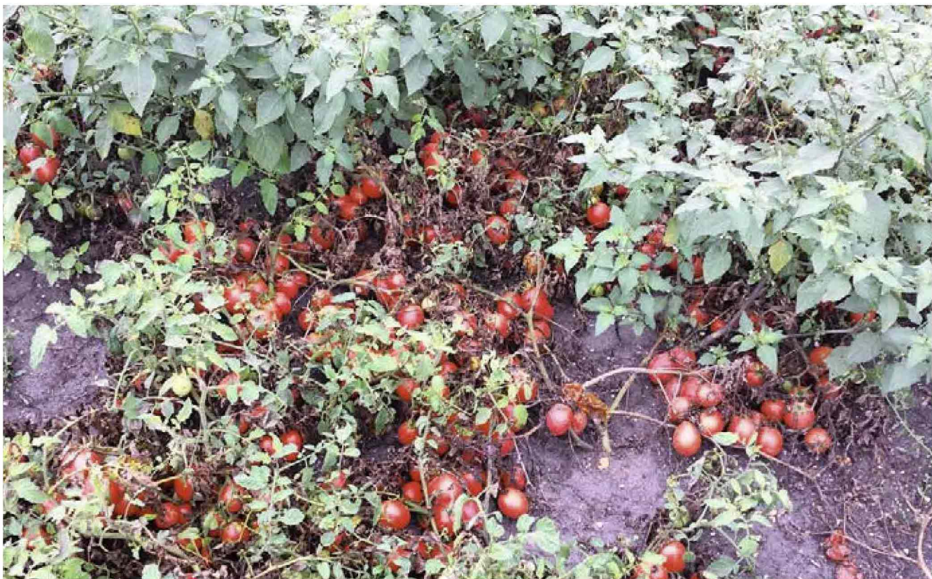
↑ La prima produzione dei pomodori vallivi nel delta del Po