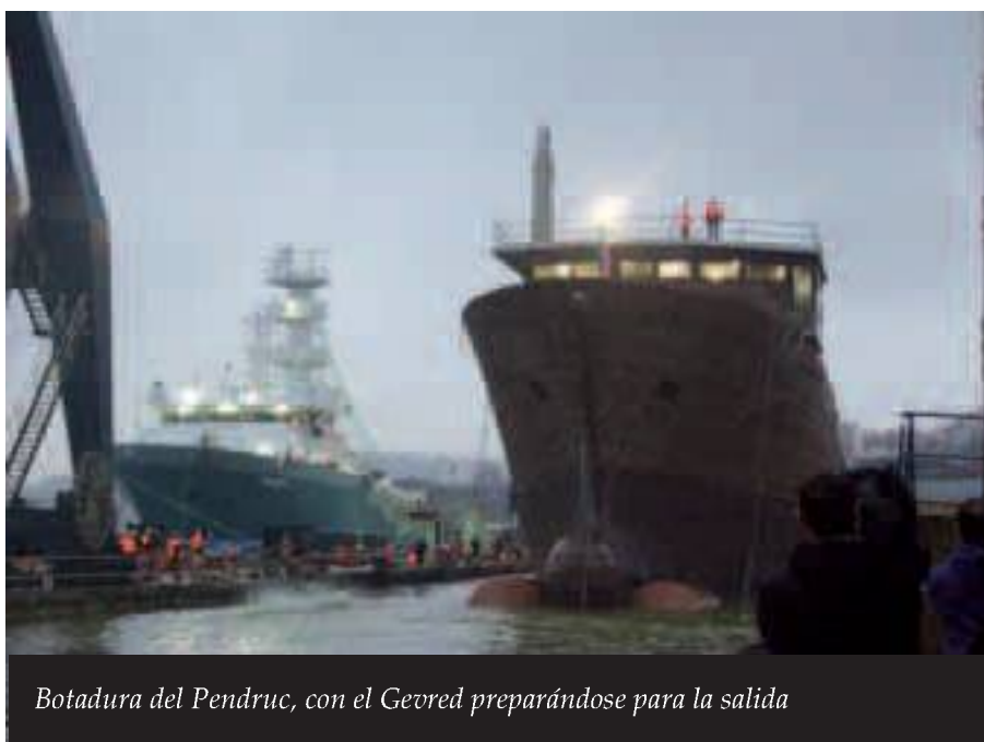
Botadura del Pendruc, con el Gevred preparándose para la salida